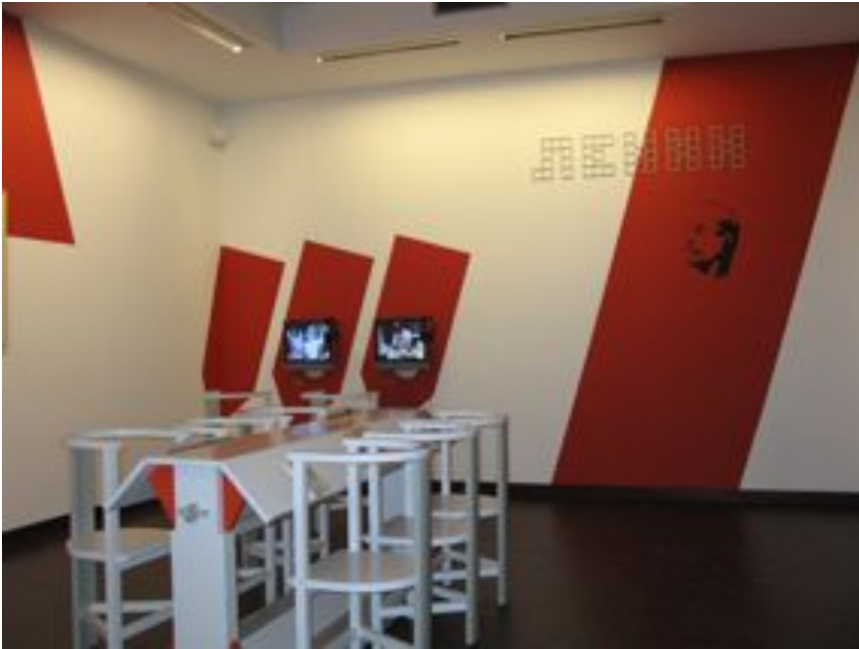
Alexander Rodchenko, Workers' Club , reconstruction (Van Abbe Museum, Eindhoven, NL)

Cuando preparábamos nuestra primera aproximación al concepto de «club activista» en Pisa me encontré una publicación en bookstorming.com y en Galerie Decimus Magnus Art Editeurs, [10] realizada por el artista francés Michel Aubry, que documentaba meticulosamente la reconstrucción del Club Obrero de Ródchenko. Resultó muy inspirador ver una de las más famosas obras de la vanguardia rusa en una reconstrucción tan asombrosamente detallada. Además, también arrojó luz sobre muchos detalles de la composición que no eran visibles en la documentación fotográfica histórica del proyecto.