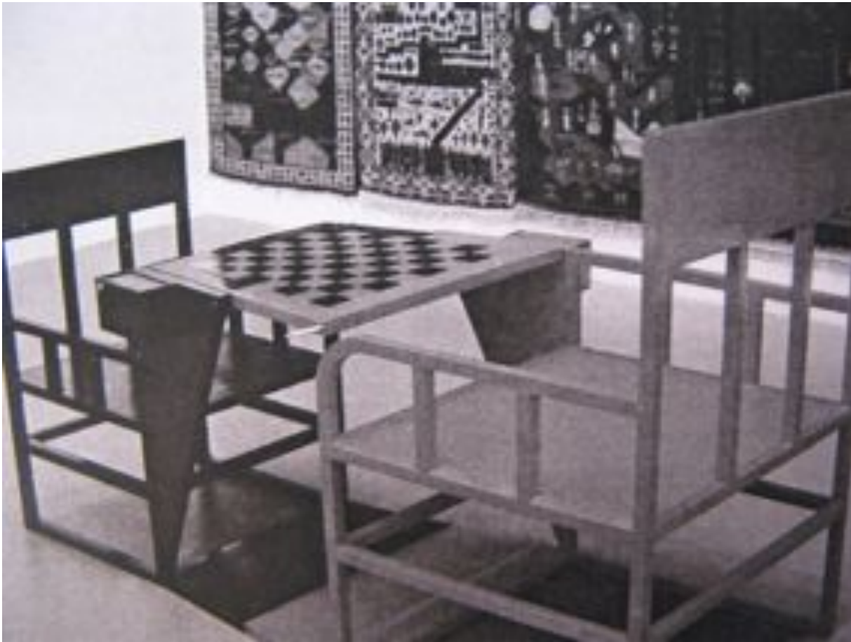
Alexander Rodchenko, Workers' Club (1925)

El objetivo de un club obrero consistía en orientar a los trabajadores en temas relacionados con la lucha política, introduciéndolos en un tipo diferente de experiencia estética e invitándolos a practicar el arte en forma de seminarios, conferencias y talleres. La idea socavaba la figura obsoleta de un consumidor ocioso, el cual, mediante la experiencia estética que se deriva de la contemplación del objeto artístico en el museo, puede supuestamente obtener placer y «emanciparse» de su miserable experiencia cotidiana. El club obrero, frente a eso, trataba de construir un espacio basado en una metodología educativa, en la creatividad y en la participación.