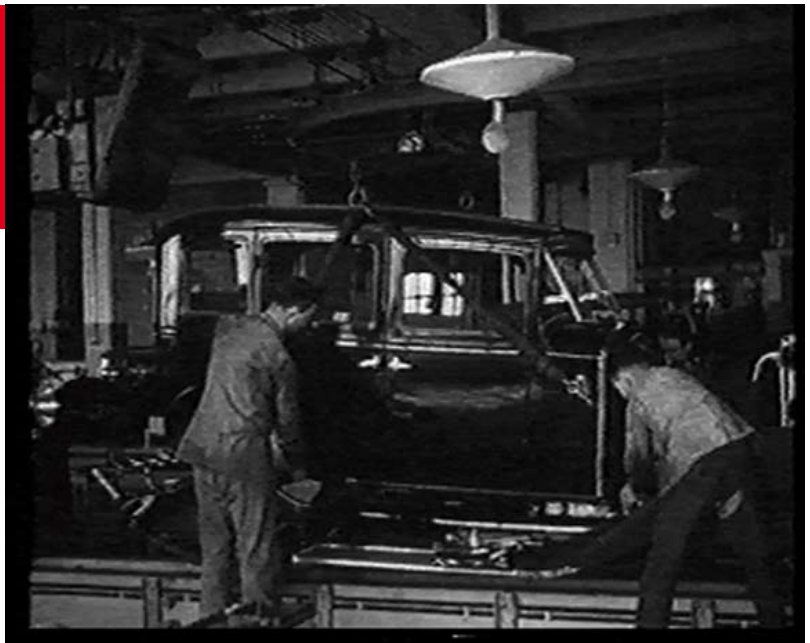
Marcelo Expósito: "Primero de Mayo (la ciudad-fábrica)", 61 minutos, 2004.