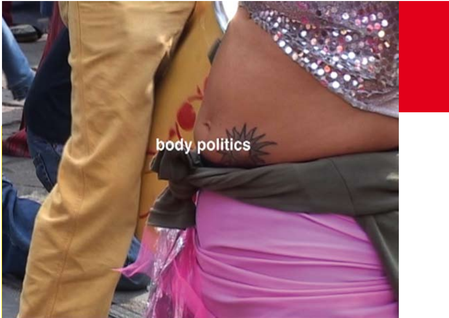
Marcelo Expósito: "Primero de Mayo (la ciudad-fábrica)", 61 minutos, 2004.