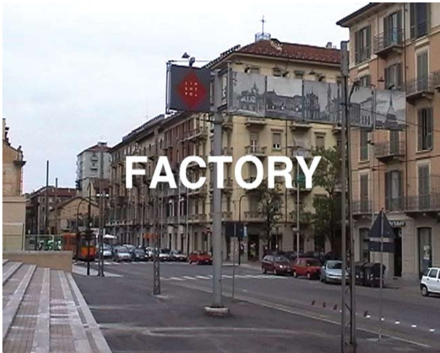
Marcelo Expósito: "Primero de Mayo (la ciudad-fábrica)", 61 minutos, 2004.