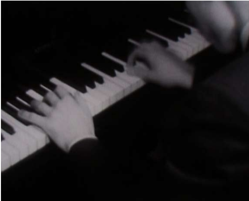
Marcelo Expósito: "Primero de Mayo (la ciudad-fábrica)", 61 minutos, 2004.