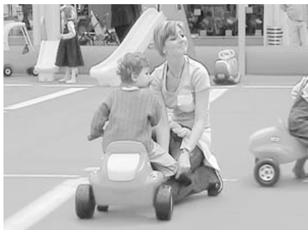
Nach der Arbeit das Spiel: das Fiat-Werk Lingotto, früher und heute

stimmt, allen Menschen gemeinsamer Partitur bestärkt diese Lesweise. Doch es ist gerade die durchgehende Qualität von Virnos Schreiben, diese Fragen der Sprache und des Intellekts als transindividuelle Grundlage der Kooperation und als General Intellekt durch teilweise überraschend an- und einsetzende Brüche und Brücken mit Komponenten einer politischen Philosophie zu verbinden.