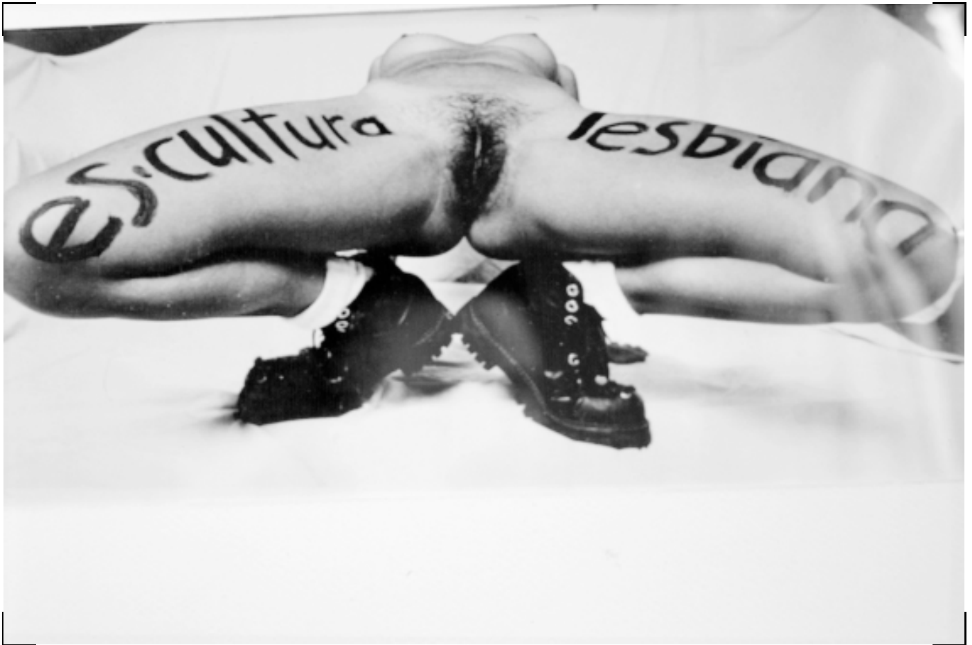
LSD Es cultura lesbiana 1994